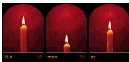
Figura 6 - Detalhe das velas "consumidas pelo tempo" no site das Apóstolas

Chama a atenção o caso da “Capela Virtual” das Apóstolas (ver Figura 6), em que, ao se acessar as velas acesas, as imagens das velas mais antigas aparecem já “consumidas” pelo tempo.