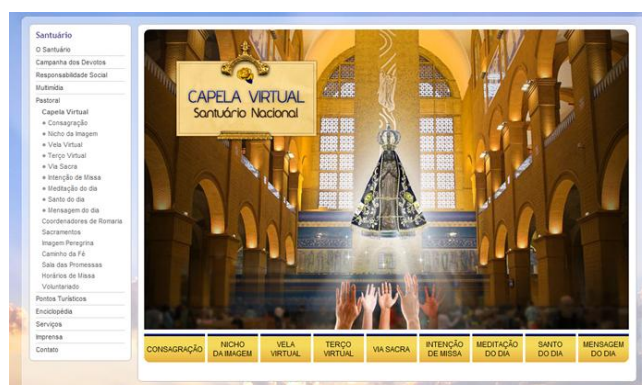
Figura 4 - Página inicial da "Capela Virtual" do site A12

Já na “Capela Virtual” do site A12 10 , assim que se acessa a página, uma imagem de Nossa Senhora Aparecida surge automaticamente, em um movimento de em zoom crescente, do fundo do quadro da “Capela Virtual”, até preencher o centro dessa moldura (ver Figura 4).