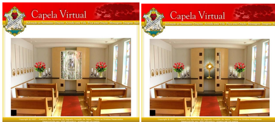
Figura 2 - Página do ritual "Adoração ao Santíssimo" do site das Apóstolas

A tela também se torna uma janela de acesso ao sagrado, por exemplo, no ritual de "Adoração ao Santíssimo" da "Capela Virtual" 7 do site das Apóstolas do Sagrado Coração de Jesus 8 (ver Figura 2).