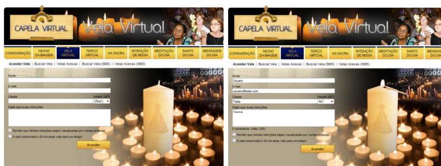
Figura 5 - Ritual "Vela Virtual" do site A12

No caso da opção “Vela Virtual” 11 da Capela, para acender a sua vela, o fiel é convidado pelo sistema a preencher um formulário (nome, e-mail, cidade, estado e intenção), escolhendo se permite que a oração se torne pública ou se quer enviar a vela também para um amigo. Depois de acionar a opção “Acender vela”, a imagem da vela que antes aparecia apagada, agora é acesa por meio de uma animação de um palito de fósforo que se aproxima do pavio e o acende (ver Figura 5)